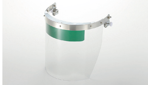
目線による遮光の使い分け