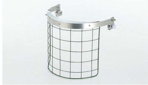
固形飛来物顔面防御