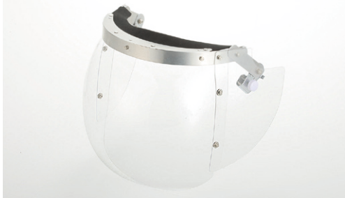
ひさし部すき間薬液侵入防止