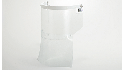
薬液対策・発塵対策