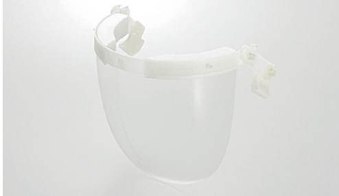
ヘッドライト装着時面上上下下可動可