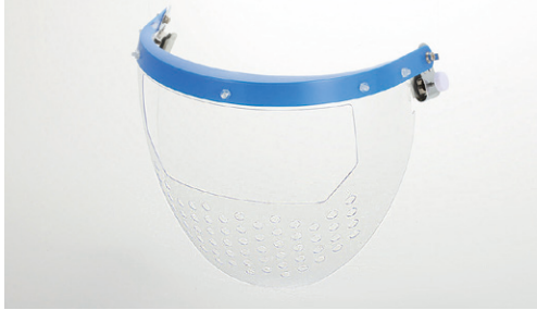
軽量・アゴ部切創防止